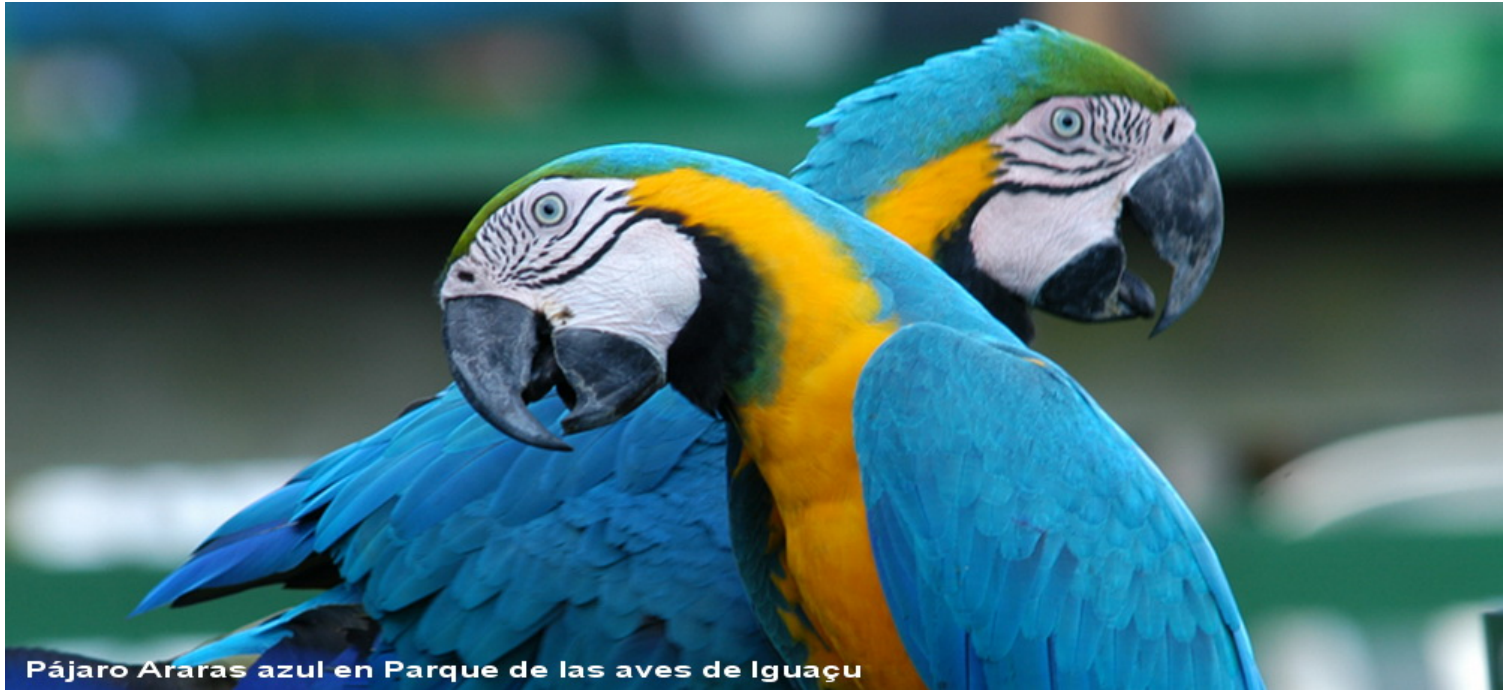
Pájaro Araras azul en Parque de las aves de Iguazu