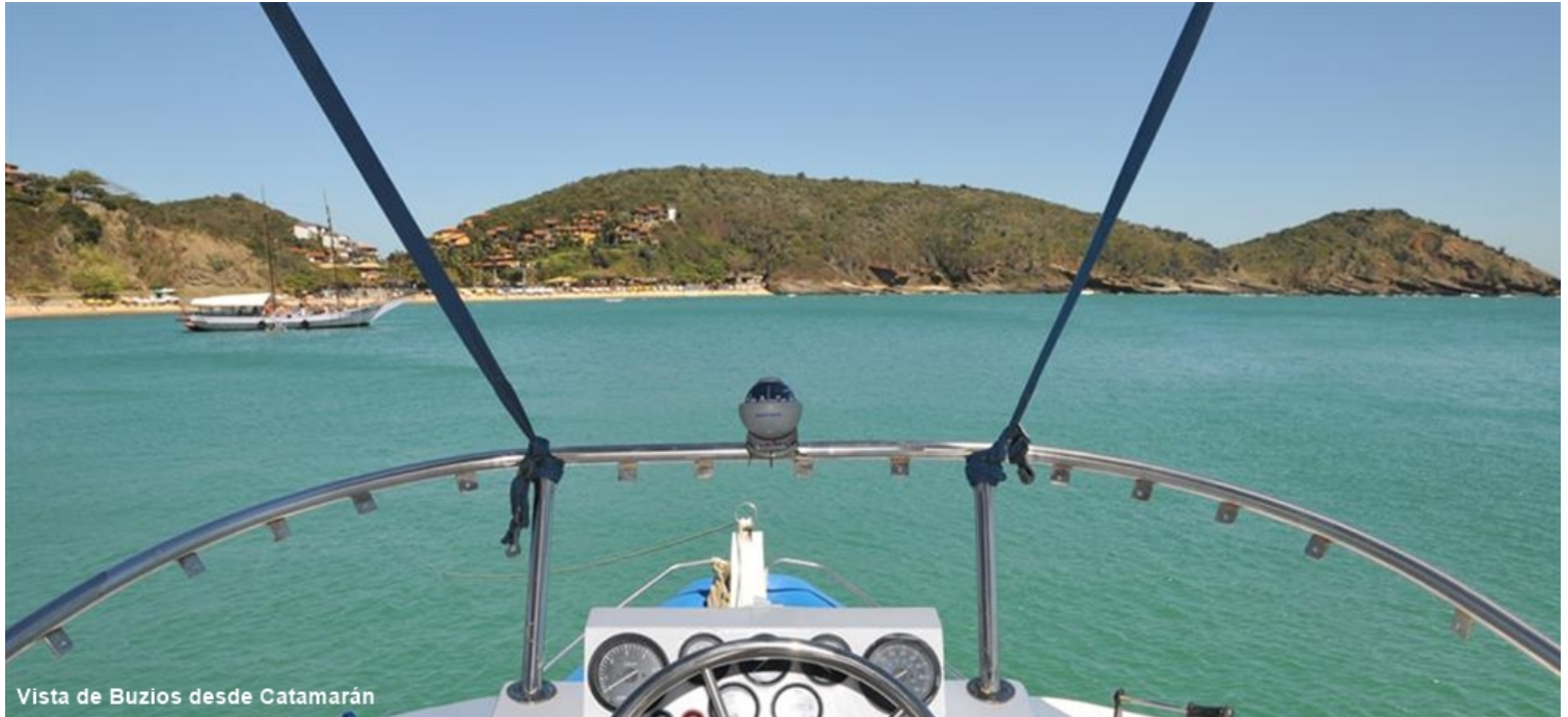
Vista de Buzios desde Catamarán